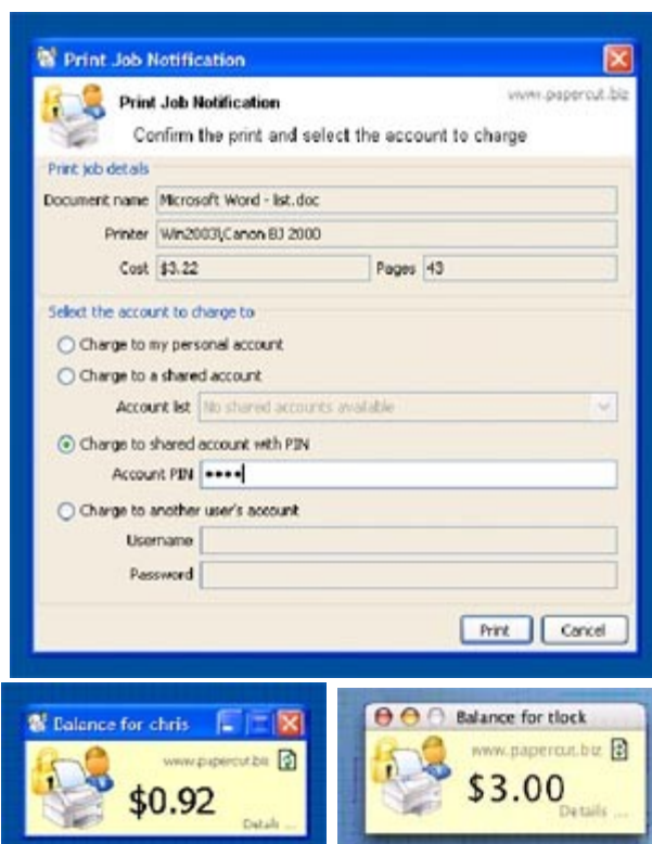
Client opcional para PC, Mac ou Linux